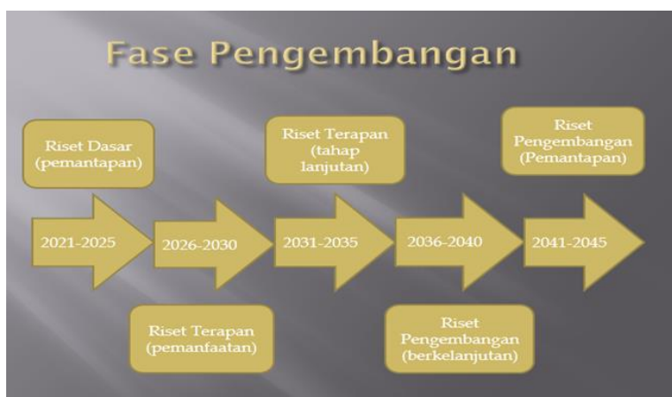
Gambar 2.2 Fase Pengembangan Penelitian dan Pengabdian

Penelitian Universitas Qomaruddin pada tahun 2045 meliputi tiga bidang fokus utama yaitu bidang teknik, pendidikan, ekonomi dan Bisnis Islam dan Hukum. Penelitian dan pengabdian masyarakat dalam bidang Ekonomi dan Bisnis Islam dibagi menjadi dua yaitu yang sifatnya fundamental dan terapan. Beberapa isu yang berkembang pada tahun 2045 adalah digital marketing dan teknologi Industri. Kedua isu tersebut menjadi penting dengan terus berkembangnya isu dan perilaku masyarakat modern yang semakin menuju pada teknologi yang lebih modern yang harus dinilai dengan kaidah islam. Adapun fase pengembangan penelitian dan pengabdian Fakultas Ekonomi dan Bisnis Islam Universitas Qomaruddin dapat diilustrasikan sebagai berikut: